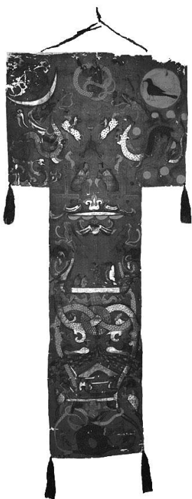
(圖一) 長沙馬王堆一號墓T形帛畫